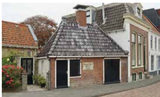
Harlingen, Rozengracht, brandspuithuisje Nr 1 uit 1767