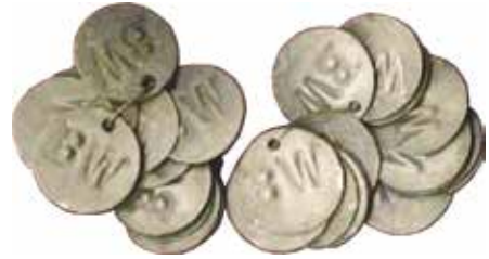
Workum, diverse brandspuitpenningen