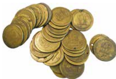
Harlingen, 33 koperen brandspuitpenningen. 1759 (collectie: GHH, inv. 000189)

komforen, tabaksdozen, zoutvaatjes, roomkommen, suiker- en peperstrooiers, vorken en lepels vervaardigde; er zijn nog steeds werkstukken van hem te vinden in het Hannemahuis.