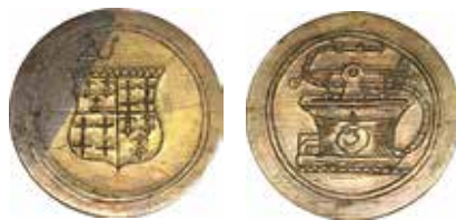
Harlingen, brandspuitpenning met het hoogste persoonsnummer. 1759 (collectie: Fries Museum Leeuwarden, inv. N13329)

Van deze penningen zijn er in het Hannemahuis nog 32 aanwezig, plus één waar een sleutel aanhangt. Ook het Fries Museum heeft drie exemplaren en er zijn vier stuks aangetroffen in veilingcatalogi; samen dus 40 stuks. De diameter is circa 45 mm en ze wegen ongeveer 23-29 gram. De rekening ervan is gevonden in het rekeningenboek van Harlingen. 4 Het lijken wat weinig penningen: 72 stuks voor vijf spuiten. Er zouden zeker 100 stuks geweest moeten zijn. Mogelijk zijn er later nog wat bijgemaakt. Ook de verdeling van de 33 in het Hannemahuis aanwezige exemplaren over de spuiten is heel ongelijk: een (reserve exemplaar?) is blanco, spuit 1: 2 stuks (inclusief het exemplaar aan de sleutel van het brandspuithuisje), spuit 2: 9 stuks, spuit 3: 7 stuks, spuit 4: 11 stuks en spuit 5: 3 stuks. De andere zeven zijn van de spuiten 2, 3 (2 stuks), 4 (2 stuks) en onleesbaar (2 stuks). De maker Hendrik Reins Brouwer (1704-1769) was op 30 maart 1747 meester goudsmid en daarnaast van 1751 tot 1769 vroedsman. Uit het keurloonboekje blijkt, dat hij schenkborden, kandelaars, tabaks-