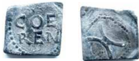
Afb. 3 Mogelijk graanloodje van Amsterdam

De vermelding van een loot-teycken lijkt er op te wijzen dat er loodjes werden gebruikt om de betaling van de maalbelasting te controleren. Uit Amsterdam zijn inderdaad drie graanloodjes bekend maar deze zijn helaas niet direct te koppelen aan deze bron. Twee loodjes hebben namelijk duidelijke parallellen met in Zeeland gevonden graanloodjes en lijken daarom niet afkomstig uit Amsterdam maar als bron van herkomst Zeeland 8) .