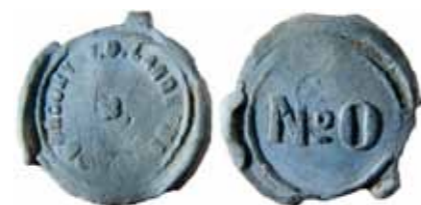
Afb. 1 Meelloodje Deventer NOURY & V.D.LANDE / No 0

De termen meelloodjes, graanloodjes en graanpenningen worden regelmatig door elkaar heen gebruikt. Hierdoor is het niet altijd duidelijk wat voor soort loodje er precies wordt bedoeld. Daarom een