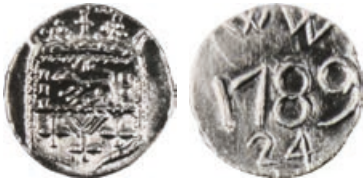
W-27/118.. vz.: leeuw naar links in wapen waaronder W/+++. kz.: WW / 1789 / 24. L. Minard van Hoorebeke, nr. 485; De Beeldenaar 2014-3