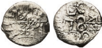
W-27/1532/91 vz.: wapen van Prins Willem V. kz.: L.C. (G.) / 1784 / 10. Pelsdonk, 09.10e, afb. 314 (ander type)