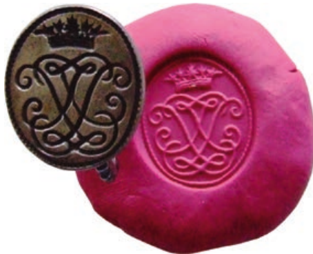
Bronzen zegelstempel met spiegelmonogram JL

Het is opmerkelijk dat er een armenpenning van een inwoner uit Dordrecht aan boord van het schip gevonden is dat uit Minard onder nummer 167 omschrijft als: "Tusschen een roosje boven en onder 24:ST/ te kennen gevende dat de bedeelde bij den penningmeester eenen onderstand kon ontvangen van 24 stuivers. Een gekarteld bandje omgeeft denzelve gedeeltelijk. In het effe veld der keerzijde het wapenschild; in het midden