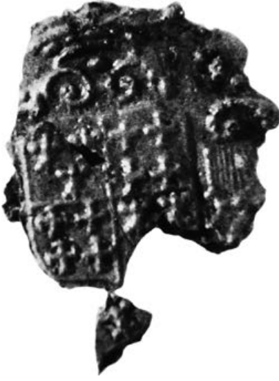
Waszegel met gemeentewapen Harlingen (vergroot)

houwde dribladige klaver wat kenmerkend is voor Nederlandse schepen (en speciaal voor de kofschepen) uit de achttiende en negentiende eeuw.