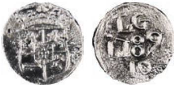
W-27/1332/90 vz.: wapen van Prins Willem V. kz.: L.C. (G.) / 1789 / 10. Pelsdonk, 09.10e, afb. 314 (ander type)