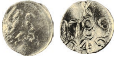
W-27/1507/91 vz.: staande leeuw naar links met zwaard en pijlenbundel (het wapen van de Staten- Generaal). kz.: K / 1789 / 24 S