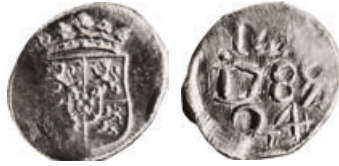
W-27/1565/90 vz.: wapen van Prins Willem V. kz.: M(D) 1789 24.