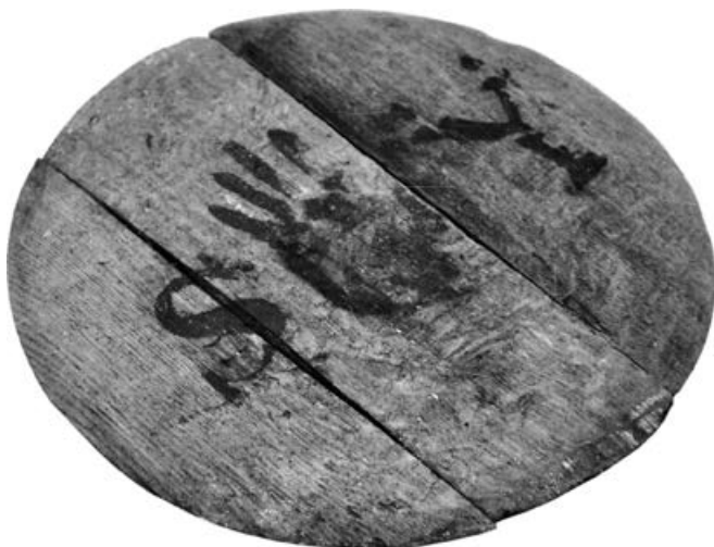
Kleine deksel met S band Y