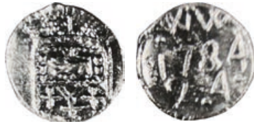
W-27/184/90 vz.: leeuw naar links in wapen waaronder W/+++. kz.: WW / 1784 / 24. L. Minard van Hoorebeke, nr. 485; De Beeldenaar 2014-3