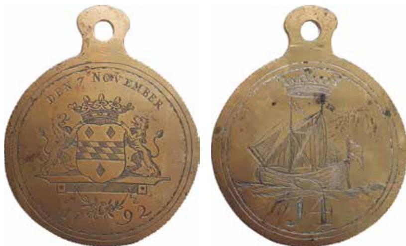
Woerden, gildepenning van het Schippersgilde, nummer 14. 1792, 68 mm exclusief oog (collectie: Stads museum Woerden, inv. 08.0005)

Van Woerden was tot voor kort maar een tweetal gildepenningen bekend, beide van het Woerdense kleermakersgilde. Op de ene staat het getal 50 en op de andere het getal 30 boven het stadswapen van Woerden. Penning nummer 30 is beschreven en afgebeeld in het werk over onder andere gildepenningen door Minard – van Hoorebeke als nummer 488. 2 Deze penning is in 1883 in de verzameling van Mr. J. Dirks terecht gekomen. De verzameling Dirks is door hem nagelaten aan het Fries Museum in Leeuwarden en als zodanig in 1958 beschreven door mevrouw O.N. Keuzenkamp-Roovers. 3 Uit die omschrijving blijkt dat Minard de