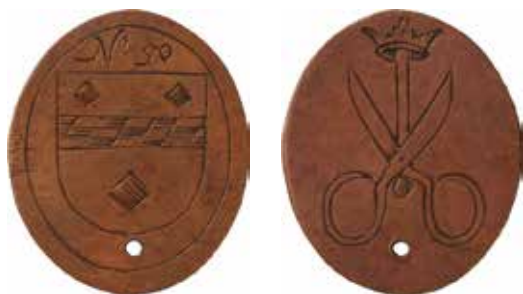
Woerden, gildepenning van het Kleermakersgilde. Circa 1700, 38 x 32 mm (collectie RMA, inv. NG-VG-7-580)

Op de voorjaarsbijeenkomst 2022 van het Koninklijk Nederlands Genootschap voor Munt- en Penningkunde heb ik tijdens mijn presentatie Woerden en de numismatiek ook de schaarse gildepenningen van Woerden besproken. 1 Hierbij kwam tevens de unieke penning van het schippersgilde aan de orde. Nu ik de beschikking heb over betere afbeeldingen wil ik naast de andere gildepenningen van Woerden deze penning en de achtergrond van het schippersgilde beschrijven in dit artikel.