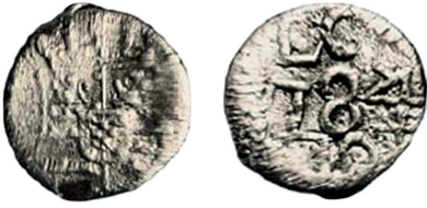
Voorzijde: wapenschild Prins Willem V. Keerzijde: L.G./1784/10. Objectnummer: W-27/1532/91, type: BL.