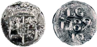
Voorzijde: wapenschild Prins Willem V. Keerzijde: L.G./1789/10. Objectnummer: W-27/1332/90, type: BL.

Er wordt verder gevaren langs de Liesche of Adelijse Gors bij Klundert. Het tarief voor de Liesche Gors was aanmerkelijk lager dan bij de andere belastinginners, namelijk 10 stuivers. In de Ordonnantie voor de pagters van het baken op het Vrouwe Adalyse Gors geleegeen in het Hollands Diep van