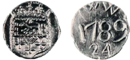
Voorzijde: leeuw naar links in wapen waaronder W/+++. Keerzijde: WW / 1789 / 24. Objectnummer: W-27/118, type: BB. Literatuur: Minard van Hoorebeke, nr. 485. 9

Vervolgens wordt Willemstad gepasseerd waar de zeewaardige schepen 24 stuivers moesten betalen. De bakenloden van Willemstad zijn uitvoerig besproken in De Beeldenaar 2014-2. 10 Tijdens de Franse bezetting wijzigt Staats-Brabant in Bataafs Brabant en verdwijnt het wapenschild van Prins Willem V van de bakenloden om plaats te maken voor diverse beeldenaars.