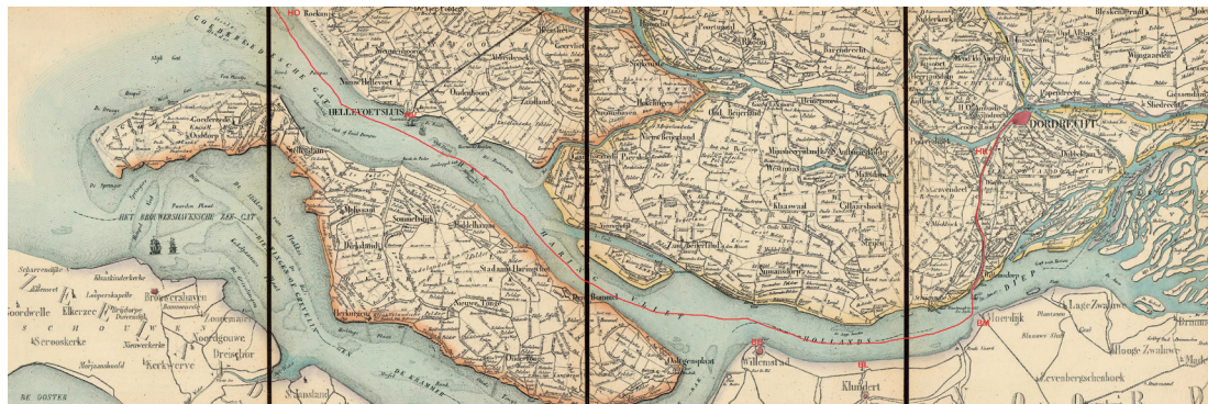
De vaarroute, aangegeven op een kaart van Zuid-Holland uit 1848 (fragment, collectie: Nationaal Archief, toegang 4.OBGK, inv. P3.98)

Opvallend is dat 6 van de 8 loodjes een waarde hebben van 24 Stuivers. Dit wijst erop dat het een groot vrachtschip betrof, in ons geval een kofschip, voor transporten naar het buitenland. Met dit gegeven ben ik op zoek gegaan naar aanwijzingen over de belasting van de verschillende instanties. Het was mij inmiddels al wel duidelijk geworden dat De Jonge Seerp in 1784 en 1789 Dordrecht had aangedaan. Wat is dan de meest voor de hand liggende scheepvaartroute gezien vanuit Dordrecht? Dat is; Mallegat of Krabbe,