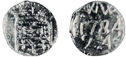
Voorzijde: leeuw naar links in wapen waaronder W/+++. Keerzijde: WW / 1784 / 24. Objectnummer: W-27/184/90.