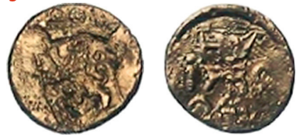
Voorzijde: staande leeuw naar links. Keerzijde: HV / 1789 / 24. Objectnummer: W-27/1558/91.