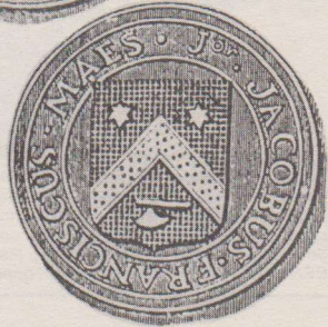
Penning van een weldoener. Op de voorzijde een wapenschild: zwart veld met een gouden keper, daarboven twee zilveren sterren en daaronder en zilveren bijl. Het omschrift luidt: JACOBUS FRANCISCUS MAES Jor. Op de keerzijde staan de bekende elementen en de aanduiding 6.