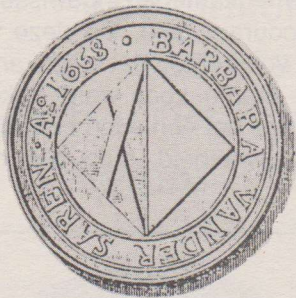
Op de voorzijde een wapenschild. Het omschrift luidt: BARBARA VANDER SAREN A. 1668. De keerzijde is identiek aan de penning van J.F. Maes.

De navolgende penning werd uitgereikt aan de armen die behoorden tot de kerkgemeenschap van de St. Pietersabdij. Op deze penning is geen waarde-aanduiding aangebracht.