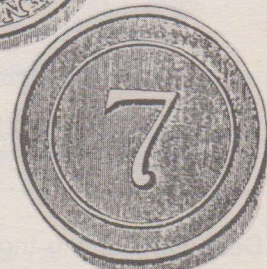
Op de voorzijde in het midden op een voetstuk een vrouw die de Vrijheid voorstelt. In de linkerhand houdt zij een speer met een vrijheidsmuts, de rechterhand steunt op een pijlenbundel. Het omschrift luidt: BUREAU DE BIENFAIT ET DISTRIBUTION (Bureau van weldadigheid). Op de keerzijde het getal 7 voor 7 stuiver.

In een volgende aflevering aandacht voor de penningen uitgegeven door kerkelijke instanties zoals de St. Bavo.