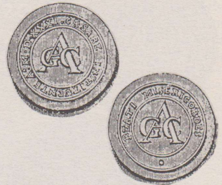
Penning met op de voorzijde een grote A en G - C in kleinere letters = Gentse Armen Camer. Het omschrift luidt: CAESARE INSTITVENTE A.o 1531. (Ingesteld door de raadsleden in 1531). Op de keerzijde een monogram als de voorzijde en het getal 5 (deniers). Het omschrift luidt: BEATI MISERICORDES. (Barmhartigheid der rijken).

De penning kon dan ingeruild worden bij de neringsdoende, in dit geval een bakker tegen brood. De penning werd dan aangeboden bij de Armenkamer en ingewisseld tegen courant geld. Op deze wijze werd voorkomen dat er iets anders (bijv. drank) voor werd gekocht. Ook was het een soort controle op de hoeveelheid hulp die nodig was.