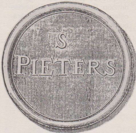
1) Keerzijde met de naam van de kerkgemeenschap St. Pieter.

Ook tijdens de Franse periode werd een penning vervaardigd om armen bijstand te verlenen. Het Franse element komt duidelijk op de voor- en keerzijde tot uitdrukking.