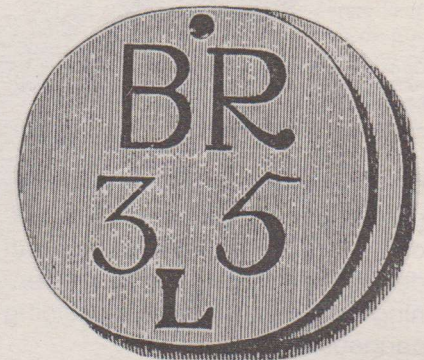
Op de voorzijde de aanduiding BR 35 L. De letters te samen vormen de aanduiding Broodloodje. Het getal 35 is een controle op het aantal uitgedeelde loodjes. De keerzijde is onbewerkt.

De penning kon dan ingeruild worden bij de neringsdoende, in dit geval een bakker tegen brood. De penning werd dan aangeboden bij de Armenkamer en ingewisseld tegen courant geld. Op deze wijze werd voorkomen dat er iets anders (bijv. drank) voor werd gekocht. Ook was het een soort controle op de hoeveelheid hulp die nodig was.