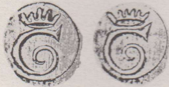
Op voor- en keerzijde een gekroonde letter G van Gent.

In Gent werden tijdens een drie weken durende schaarste op 3 juli 1557 zgn. weldadigheidspenningen geslagen. Dit op last van de Gentse Magistraat toen de nood het grootst was. Men kon ze bij het stadhuis krijgen tegen de prijs van 26 stuiver. Ze gaven recht op een 'meuken' graan.