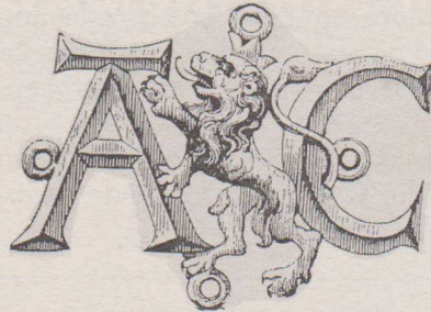
Gekroonde Gentse leeuw met de voorpoot rustend op de letter A. In zijn gekrulde staart de letter C en voorzien van vier bevestigingsoogjes. Dit teken werd gegoten in lood.

Deze verplichting ingevoerd door keizer Karel V, werd verder aangevend door de Gentse Armenkamer. Zij gaven het teken een meer eigen tint mee. De Gotische letter A en de bevestigingsoogjes werden behouden. De letter G van Gent werd vervangen door de Gentse leeuw en in plaats de letter G kwam een C voor Camer.