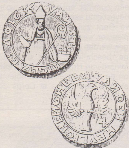
St. Nikolaaskerk. Op de voorzijde de heilige Nikolaas gekleed in bisschopsgewaad met mijter en een staf in de linkerhand. Aan de rechterzijde drie kinderen in een ton. Het omschrift luidt: VAN ST NICLAES Ao. 1655. Op de keerzijde is een duif afgebeeld, symbool voor de Heilige Geest, rechts van de duif het cijfer 4 voor vier stuiver. Het omschrift luidt: VAN DEN HEYLIGHEN GHEEST.

Met het uitgeven van deze armenpenningen hoopte men de behoeftigen enige verlichting te geven en hen te sterken in het geloof.