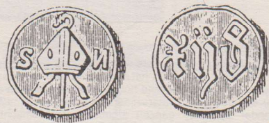
St. Nikolaaskerk. Op de voorzijde een staf en bisschopsmijter, links S(int) en rechts N(ikolaas). Op de keerzijde in Gotisch schrift de aanduiding XIID voor 12 deniers.

Deze aflevering van de serie over de Gentse bijstand- en armenpenningen geeft een overzicht van de uitgaven van de kerkelijke instanties. Vanaf de vroege middeleeuwen nam de armenzorg een belangrijke plaats in bij de activiteiten van de geloofsgemeenschap. Om te voorkomen dat het geld dat hiervoor beschikbaar was voor andere doeleinden werd aangewend dan de opzet was, gaf men penningen uit die recht gaven op brood, turf enz.