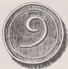
Armenpenning zonder jaartal. Op de voorzijde de beelde naar als hierboven beschreven. Op de keerzijde nu het cijfer negen.