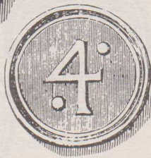
Armenpenning zonder jaartal. Op de voorzijde de beelde naar als hierboven beschreven. Op de keerzijde nu het cijfer 4 tussen twee punten.

Naast de 'normale' armenpenningen die recht gaven op voedsel, kleding of turf, waren er ook de zgn. bid- of geloofspenningen voor het zieleheil de armen. Als voorbeeld tonen wij u een de Heilige Sacramentskapel. Na het bijwonen van de mis gaf ze recht op een brood.