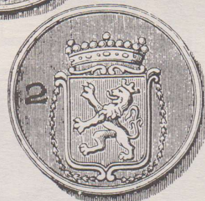
Armenpenning. Een soortgelijke penning als hierboven beschreven. Op de keerzijde is nu het bedelingsnummer 2 ingeslagen.