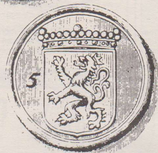
Armenpenning. Op de voorzijde staat het wapen van St. Bavo afgebeeld. Het is een pelikaan met gespreide vleugels en een bisschopsstaf boven het hoofd en het gekroonde wapenschild van de stad op de borst. Op de keerzijde is het gekroonde stedelijke wapenschild afgebeeld. Aan de linkerzijde is het cijfer 5 ingeslagen.