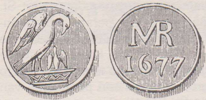
Armenpenning uit 1677. Op de voorzijde van deze penning staat een pelikaan met jong, samen in een mand afgebeeld. Op de keerzijde staat een monogram van de letters MR en het jaartal afgebeeld.