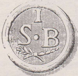
Armenpenning zonder jaartal. Op de voorzijde de letters S(int) B(avo) twee gekruiste korenaren en het cijfer I. De keerzijde heeft dezelfde voorstelling.