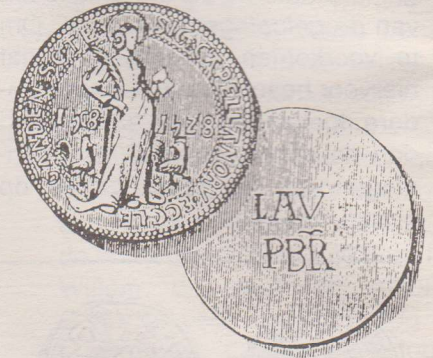
Armen penning 1428. Op de voorzijde staat een afbeelding van Sinte Pharaillidis het hoofd met een lichtkrans omgeven. In de rechterhand houdt zij een palmtak, in de linker een bijbel. Aan weerszijden staat het jaartal 1428, hieronder zijn twee ganzen afgebeeld. Het omschrift luidt: SIG. CAPELLANORV. ECCLIE. GANDEN. SC. TE. Op de keerzijde staan de letters LAV / PBR afgebeeld. Deze staat voor: Looft Armen U Pharaillidis Brood.

Het is er een van de Ste. Pharailliskerk. De reden van de miskenning is misschien het feit dat deze kerk in 1875 werd afgebroken.