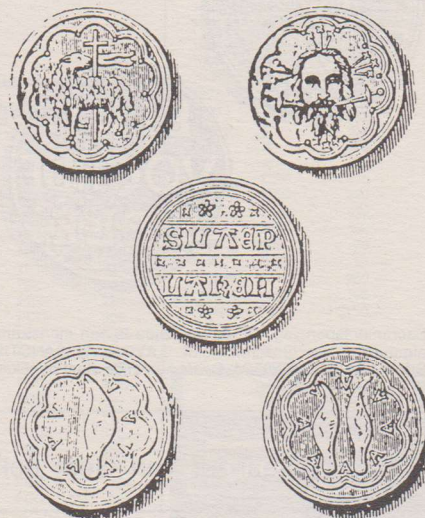
Penning voorzien van een Christusportret gevat in een epicycloïde met tien bogen. Om het hoofd zijn twaalf spijkers geplaatst. De mond is doorstoken met twee zwaarden.

uitgegeven door het armenbestuur van de Sint Bavokerk. Het betreft hier geld- en goederenpenningen. Op de gemeenschappelijke voorzijde staat het Lam Gods afgebeeld, de kop naar rechts gewend. Verder een banier, het geheel is gevat in een epicycloïde met tien bogen.