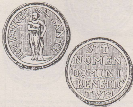
St. Janskerk. Op de voorzijde is Sint Johannes ten voeten uit afgebeeld voorzien van een nimbus (lichtkrans). In zijn armen houdt hij het Lam Gods. Het omschrift luidt: SANTE IOHANNES. In het Latijn wordt de letter J als een I geschreven. Op de keerzijde staat de tekst: SIT NOME DOMINI BENEDICTUM (De naam des Heere zij geloofd).

Behalve de stad Sint Niklaas in België die naar deze heilige is vernoemd, was deze bisschop uit Myra (Turkije) de stadspatroon van verschillende steden o.a. Amsterdam. De volgende penningen werden