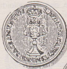
Sacramentspenning. Op de voorzijde is een monstrans afgebeeld. Het omschrift luidt: LAV DATVR SANCTIS SIMVM SACRAMENTVM. Op de keerzijde staat de tekst: BIDT VOORDE SIELE.

Naast de 'normale' armenpenningen die recht gaven op voedsel, kleding of turf, waren er ook de zgn. bid- of geloofspenningen voor het zieleheil de armen. Als voorbeeld tonen wij u een de Heilige Sacramentskapel. Na het bijwonen van de mis gaf ze recht op een brood.