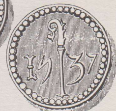
Armenpenning uit 1437. Op de voorzijde is nu een pelikaan met gespreide vleugels, staande op een nest afgebeeld. Op de keerzijde staat een bisschopsstaf afgebeeld geflankeerd door het jaartal.