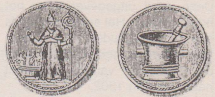
Sint Nikolaas met mijter en staf in zijn linker hand, zegent met de rechter hand drie kinderen in een ton. Op de keerzijde staat een vijzel met twee handvatten en een stamper. Dit is een algemene penning van verschillende neringen.

De hierboven afgebeelde penning werd gebruikt door meer dan één nering. Deze hadden meedere patronessen en patroons maar de hoofdpatroon was Sint Nikolaas.