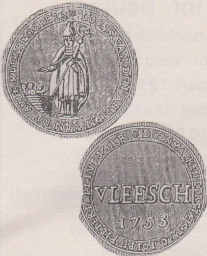
Beeldtenis van St. Nikolaas in bisschopsgewaad met mijter en staf in de linker hand. De rechterhand houdende boven kinderen in een ton. Het omschrift luidt: LOONS VAN DEN ARMEN VAN DE AUDE KLEERKOOPERS. Op de keerzijde de tekst VLEESCH en het jaartal 1753. Het omschrift luidt hier: DOEN MAEKEN EERST GESW. G. POPPE PIETERS DAEL INT JAER 1753.

Net als in andere middeleeuwse steden in de Noordelijke en Zuidelijke Nederlanden kende ook de stad Gent een armenzorg. Deze armenzorg werd door verschillende instanties gefinancierd, deels door de gilden, deels door de kerkelijke instanties maar ook door weldoeners en de stedelijke overheid.