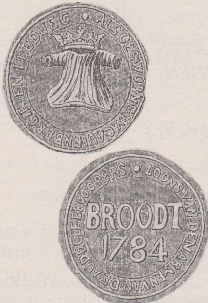
Uitgesteld kleed met kroon. Het omschrift luidt: ALS GESWORNE I.V. CAUVENBERGE EN I. LEDUEC. Op de keerzijde de tekst BROODT en het jaartal 1784. Het omschrift luidt: LOONS VAN DEN ARMEN VAN DE AUDE KLEERKOOPERS.

Krachtens een Concession Caroline werden ze bij het kleermakersgilde ondergebracht. Van deze nering werd reeds melding gemaakt in de rekeningen van de veldtocht naar Douai in 1302. Op het patroonsfeest, 6 december, deelde ze "na het bijwonen van een mis, opgedragen aan hun patroon" brood en vlees uit aan de armen. Gewoonlijk waren dat 106 broden, elke arme kon er twee bekomen tegen afgifte van een penning. De verdeling ging als volgt te werk: de gezworenen van dienst deelden er 76 uit, de aftredende gezworenen 24 en de bode de laatste 6.