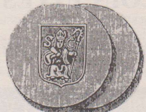
Op de voorzijde een wapenschild met daarin de patroon van het smedersgilde, St. Eloisius in bisschopsgewaad met mijter en bisschopsstaf in de linkerhand en de letters S.G. wat SmedersGilde betekent. De keerzijde is blanco gelaten voor het aanbrengen van een volgnummer.

De volgende armenpenning was van de grauwwerkers en de lammenwerkers. Deze nering werd in Vlaanderen door alle regerende vorsten erkend en is na de Concession Caroline zelfstandig gebleven. In het register V.V. dat zich in het stadsarchief bevindt staat op bladzijde 134 een ordonnantie uit 1639 waar verschillende regels van deze nering werden geregeld.