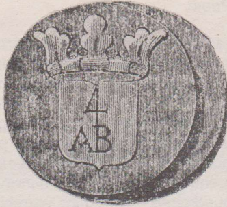
Voorzijde: gekroond schild op een effen vlak met in het schild het cijfer 4 en de letters A.B. Het getal vier was de waarde en de letters A.B. betekende 'Armen Brood'. Keerzijde: effen vlak bestemd voor het aanbrengen van een nummer waaraan de eigenaar herkend kon worden.

wordt vermeld in de veldtocht van de Vlamingen in 1302 naar Douai.