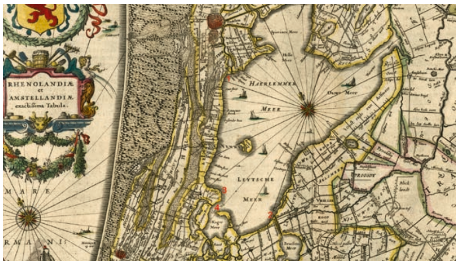
Zeventiende-eeuwse kaart van Rijnland (detail), met: 1. De (stenen) Lantaarn bij de mond van het Spaarne 2. De (houten) Lantaarn bij de mond van de Oude Wetering 3. De kruisbaak of baspel bij Lisserbroek 4. De tonnebaak op het eiland Abbene