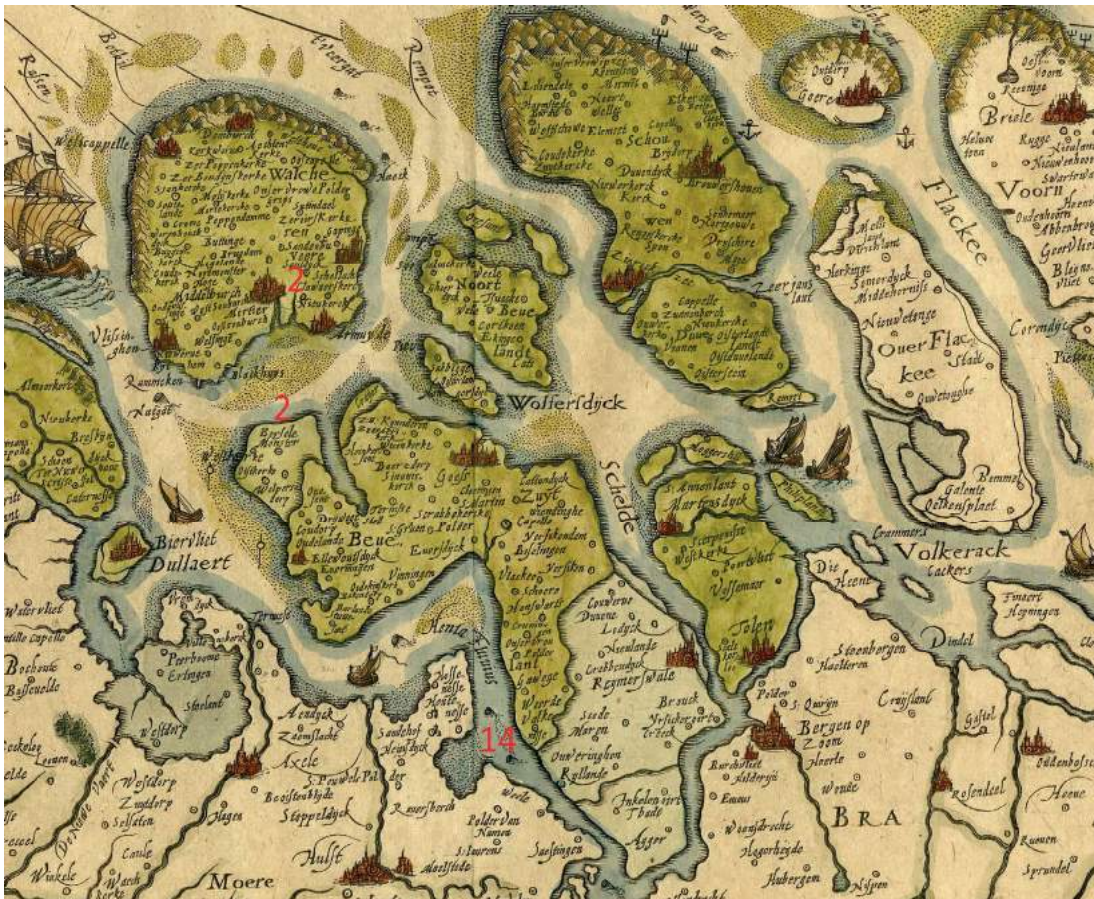
Afb. 5 Detail van een kaart van de Provincie Zeeland uit 1588-1608 met het overzicht van vindplaatsen en aantallen mogelijk graanloodje uit Valkenisse

Nu Valkenisse als bron voor de loodje herleid is, komt de volgende stap van het onderzoek aan de orde, namelijk de betekenis van de letters. De betekenis van de letters op de loodjes uit Valkenisse kan net als op de graanloodjes uit Hoorn een afkorting zijn voor de graanmaat (r voor rogge en t voor tarwe). 12 Met dit gegeven kunnen de rechter letters B, M, R en T worden herleid naar de graansoorten boekweit (B), mout (M), rogge (R) en tarwe (T). Vanuit onderzoek naar graanloodjes in Hoorn is bekend dat rogge en tarwe het meeste voorkomen als graansoort op graanloodjes. 13 Dit patroon zien we ook terug bij de loodjes uit Valkenisse. Er zijn namelijk acht loodjes met een R, negen met een T, één met een B en één met een M. Op basis van dit