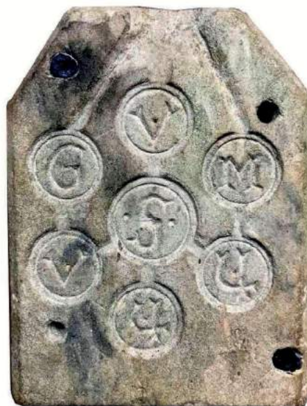
Afb. 9 Dubbelzijde gietmal voor loden penningen.

letters zijn te koppelen aan graanloodjes. De letters op de gietmal van Nieuwlande kunnen net als bij de graanloodjes uit Valkenisse staan voor de eerste letter van een graansoort of graanmaat. De graansoorten tarwe (T) en rogge (R) komen zoals eerder vermeld in dit artikel het meest voor op graanloodjes. De letters T en de R ontbreken echter op de gietmal uit Nieuwlande. Het is vanuit dit gegeven niet logisch dat de letters staan voor een graansoort. De volgende stap is te kijken naar de graanmaat. Het vermelden van alleen de eerste letter van een graanmaat op een loodje is niet uniek. Dit komt namelijk, zoals eerder vermeld in dit artikel, voor bij graanloodjes uit Warmenhuizen (zie afbeelding 10). 21