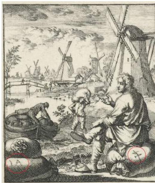
Afb. 2 Detail gravure uit 1694 van de molenaar, Jan Luyken, zak links gemerkt met de letters I. A. en zak rechts is voorzien van een huismerk.

volledig vermeld op de loodjes uit Enkhuizen, Hoorn en Stede Broec maar niet de graanmaat mud. Deze staat op de loodjes aangegeven met de letter M (zie afbeelding 1). Het afkorten van een graanmaat komt meer voor, want op de loodjes uit de heerlijkheid Warmenhuizen zijn alle graanmaten afgekort met een letter, namelijk de letter S voor zak en V voor viertel. 3 Het derde kenmerk dat voorkomt op graanloodjes is een merkteken dat later is toegevoegd. Het merkteken is aangebracht in de vorm van een huismerk, letters of een heraldisch wapen. Dit merkteken is zeer waarschijnlijk het teken van de aanbrengrer