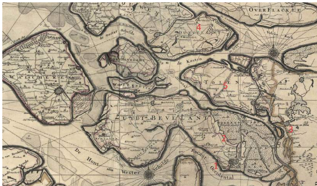
Afb. 3 Detail van een kaart van Nicolas Sanson uit met Valkenisse (1), Nieuwlande (2), Bergen op Zoom (3), het eiland Duiveland (4) en Scherpenisse (5).

De zoektocht naar mogelijke graanloodjes van het verdronken dorp Valkenisse start in de catalogus van het boek "Pennincxkens van Lode". In dit boek staan namelijk vijf Zeeuwse loodjes afgebeeld die overeenkomsten vertonen met graanloodjes uit Hoorn. 9 De loodjes in de catalogus zijn rond, voorzien van twee letters en een merkteken (zie afbeelding 4). De letters komen voor in een gotisch en een klassiek lettertype. Op basis van het lettertype zijn de loodje met het gotische lettertype te dateren vóór 1521 en met een klassiek lettertype na 1521. In 1521 werd namelijk een nieuwe emissie munten uitgegeven met een klassiek opschrift waarna stempelsnijders (ook voor loden penningen) het klassieke lettertype gingen gebruiken. 10