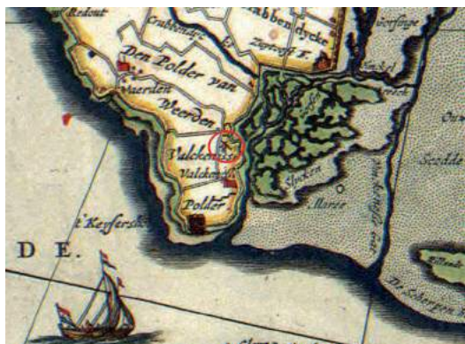
Afb. 8 Detail, Kaart Visscher en Roman uit 1655/56. De molen van Valkenisse is met rood omcirkeld.

Met dit laatste kenmerk zijn alle kenmerken die kunnen voorkomen op een graanloodje te koppelen aan de loodjes uit Valkenisse. Dit betekent dat de in Valkenisse gevonden loodjes graanloodjes zijn. De volgende stap is om te bekijken of deze graanloodjes ook in Valkenisse zijn gebruikt. Voor het gebruik van graanloodjes moet in of in de omgeving van Valkenisse een graanmolen hebben gestaan. Op een kaart van Visscher en Roman uit 1655/56 staat bij het dorp Valkenisse een molen (zie afbeelding 8). Dit is ongeveer 50 jaar nadat graanloodjes zijn vervangen door papieren biljetten. Het is niet ondenkbaar dat deze molen hier al langer stond maar dat kan helaas niet feitelijk worden onderbouwd vanuit historische bronnen omdat er zoals eerder vermeld weinig bronnen uit deze periode over zijn gebleven door overstromingen van het dorp.