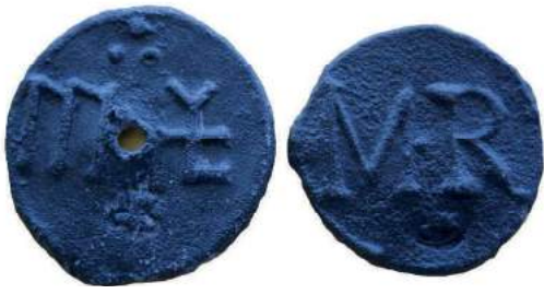
Afb. 4 Mogelijk graanloodjes uit Valkenisse, links gotisch letter type en rechts klassiek letter type.

De eerste stap is om te onderzoeken of de precieze herkomst van de loodjes kan worden bepaald. De vermelde vondstlocaties zijn Middelburg (2 exemplaren), Borssele (2 exemplaren) en Valkenisse (14 exemplaren) (zie afbeelding 5). 11 De grootste concentratie loodjes (78%) is in Valkenisse gevonden. Op basis van dit gegeven is