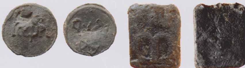
Afb.3. De twee gemelde graanloodjes uit Amsterdam. Ronde loodje met de graanmaat scapel, teken en rad. Rechthoekige loodje met de graanmaat M en een kruis.

Wanneer de hypothese klopt dat het rad staat voor een rosmolen en de loodjes afkomstig zijn uit