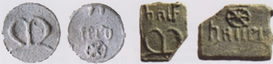
Afb. 2. Links graanloodje gevonden in Reimerswaal en rechts het Graanloodje gevonden in Amsterdam (uit het vorige artikel).

Helaas is op basis van de aantallen geen scherpe toewijzing mogelijk. Misschien dat een toewijzing is te baseren aan de hand van de kenmerken die op de loodjes voorkomen. Graanloodjes hebben één of meer van de volgende drie kenmerken namelijk: graansoort, graanmaat en het teken van de aanbrenner van het gemaal. De gotisch teksten op voorzijde en keerzijde van loodjes zijn te herleiden naar een graansoort en een graanmaat. Helaas is maar op één loodje de graansoort goed leesbaar en dat betreft de graansoort haver (afb. 2). Op basis van de graansoort haver zijn de loodjes niet specifiek toe te wijzen aan Amsterdam of Reimerswaal. De graansoort haver komt daarvoor namelijk te algemeen voor. De volgende graanmaten zijn op de voorzijde van de loodjes terug te vinden. Een graanmaat die begint met de letter M en de graanmaat scapel (scapel). (afb. 3) In beide steden (Amsterdam en Reimerswaal) is een graanmaat te vinden die begint met de letter M. De graanmaat mut in Amsterdam en de graanmaat meuke in Reimerswaal. 1 De graanmaat scapel werd echter niet gebruikt in Reimerswaal maar wel in Amsterdam. 2 Op basis van de graanmaten op de loodjes zijn de loodjes daarom toe te wijzen aan Amsterdam. Dit betekent dat