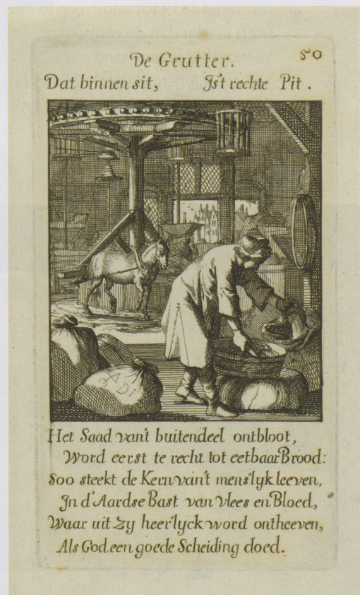
Afb. 4. Rosmolen met rad. De Gruttenmaker, Caspar Luyken, naar Jan Luyken, 1694, link detail van een graanloodje met de afbeelding van een rad.

de wieken van een molen kunnen voorstellen. Het vierde kenmerk is hiermee te koppelen aan de stad Amsterdam.