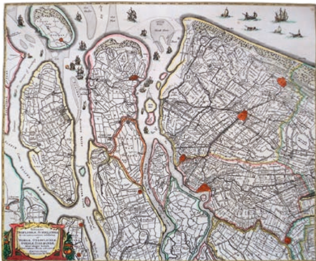
Kaart van het zuidelijkste deel van Holland door Frederik de Wit, circa 1690