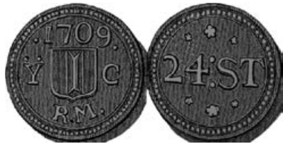
Minard 166, Kussendrager type HM

Na deze eerste vondst kon ik vervolgens in Engeland een exemplaar uit 1743 aankopen en later exemplaren uit 1756 en 1757. Deze loodjes zijn gevonden in Rogate, West Sussex (UK). Andere exemplaren waarvan de vindplaats bekend is, komen uit de omgeving van Londen, Hindeloopen en Zuid-West Friesland. Met name door de buitenlandse vondsten ben ik gaan twifelen aan de juiste toeschrijving als armenpenning van Dordrecht. Hiervoor waren verschillende redenen: