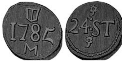
Minard 167, Kussendrager type HO