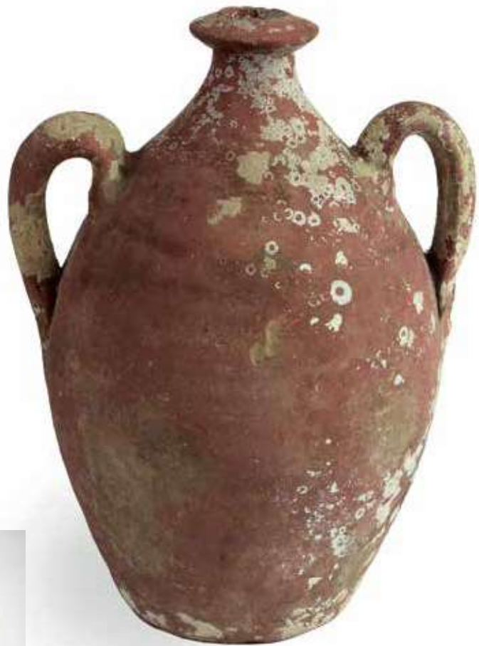
Olijfoliekruikje van Portugees roodbakkend aardewerk.