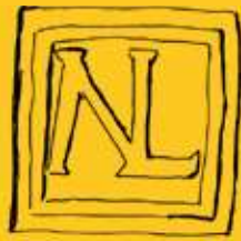
Tekeningen van diverse merken.