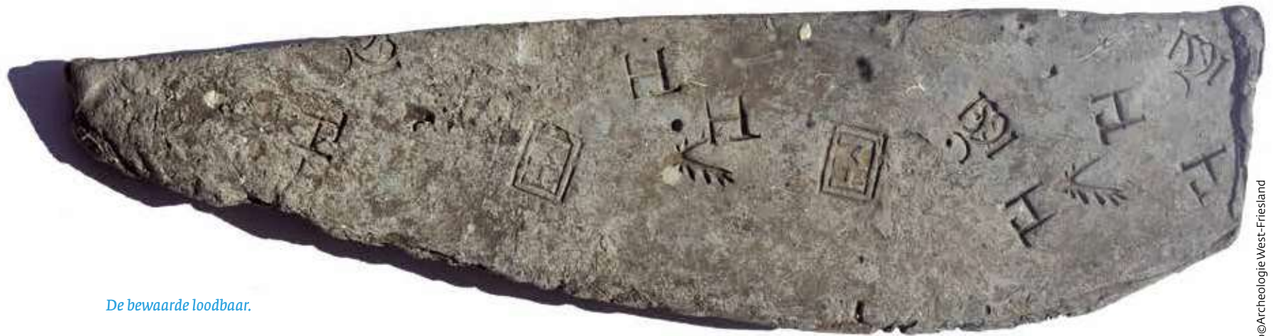
De bewaarde loodbaar.

graanschip dat in Pruisen of de Baltische gebieden was volgeladen. Naast een ruim vol graan liggen in het wrak ook balen stro en boekweitdoppen die als verpakkingsmateriaal voor breekbare lading dienden. Meest opvallend is de vondst van tientallen broodvormige loodbaren met een totaalgewicht van 2.900 kg waarop tientallen stempels zijn aangebracht. Slechts één exemplaar is uiteindelijk bewaard gebleven. Hiervan konden exacte afmetingen gedocumenteerd worden. De baar is conisch van vorm met één puntig uiteinde en een platte zijde. Het object is 45 cm lang, 17 cm breed en 10 cm hoog en weegt 62 kg. Hierbij moet worden aangetekend dat in een ver verleden een punt is afgezaagd voor metalurgisch onderzoek. Van de overige loodbaren zijn de gewichten tussen de 60 kg en 200 kg geschat. De merken op deze exemplaren zijn wel getekend. Opmerkelijk is de aanwezigheid van de jaartallen 1590 en 1591 op diverse