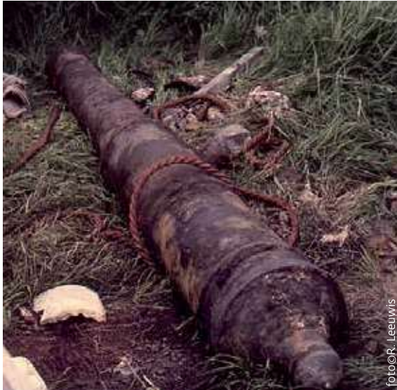
Gietijzeren kanon uit het wrak.