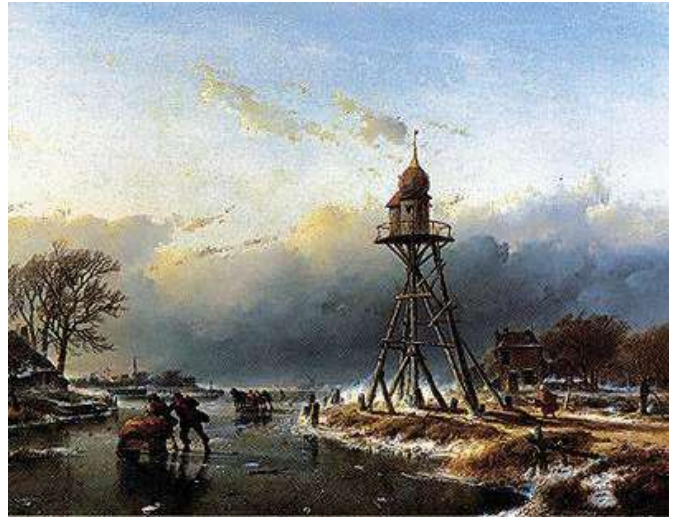
De vuurbaak bij de Oude Wetering, Leimuiden, zoals geschilderd door Andreas Schelfhout in 1852

Een volgende generatie schippers, verzocht omstreeks 1670 weer om de oprichting van een vuurbaken. Het verzoek werd nu gericht aan de burgemeesters en regeerders van de stad Haarlem. De stad reageerde snel en adequaat. Mogelijk zag het Haarlemse bestuur in de oprichting van vuurbakens (en de bijbehorende contributie door schippers) een kans om het scheepvaartverkeer nog meer via het Spaarne te leiden. Er werden maar liefst twee vuurbakens gebouwd, een aan het Spaarne en de tweede aan de Oude Wetering. Ook wist Haarlem een organisatie op poten te zetten voor de inning van de bakengelden en een administratie met de verantwoording van de inkomsten en uitgaven, inclusief een soort accountantsverklaring door de 'rendant' 1