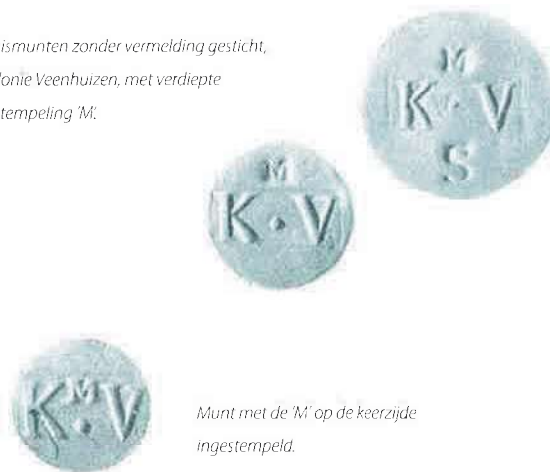
Munt met de 'M' op de keerzijde ingestempeld.