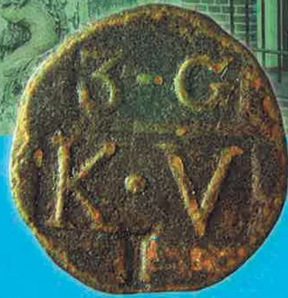
Huismunten van het 3e Gesticht, kolonie Veenhuizen, met de waarde 5, 10, 25 en 40 cent.

Voor zover bekend werden de munten het eerst in 1822 in de dwangkolonie te Ommerschans (Overijssel) ingevoerd. In een Koninklijk Besluit van 23 mei 1861 werd het gebruik van de gevangenis-munten in gevangenis-sen per 1 juli 1861 verboden.