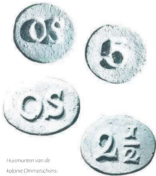
Huismunten van de kolonie Ommerschans.