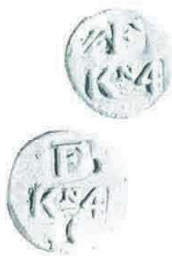
Huismunten van de kolonie Frederiksoord.